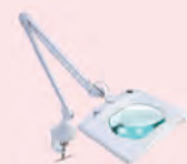
Lupa com Iluminação Modelos Morsa e Pedestal