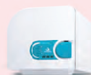
Autoclave Vitale 12 e 21 Litros