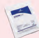
Indicador Químico Integrador SteamPlus