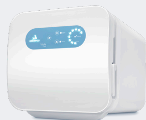
Autoclave Vitale Class 12 e 21 Litros