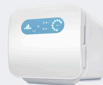
Autoclave Vitale Class

11 Com o suporte de envelopes na autoclave realize o ciclo de esterilização conforme as recomendações de uso. Observação: No modelo Vitale 5 litros, um suporte para 8 envelopes acompanha o equipamento. Para os modelos Vitale Class e Vitale Class CD, o suporte é um acessório vendido separadamente e comporta até 13 envelopes 9 x 26 cm no modelo 12 litros e 26 envelopes no modelo 21 litros, utilizando 2 suportes.