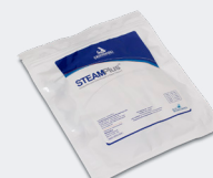
Indicador Químico Integrador SteamPlus