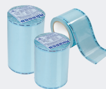
Embalagens Tubulares para Esterilização