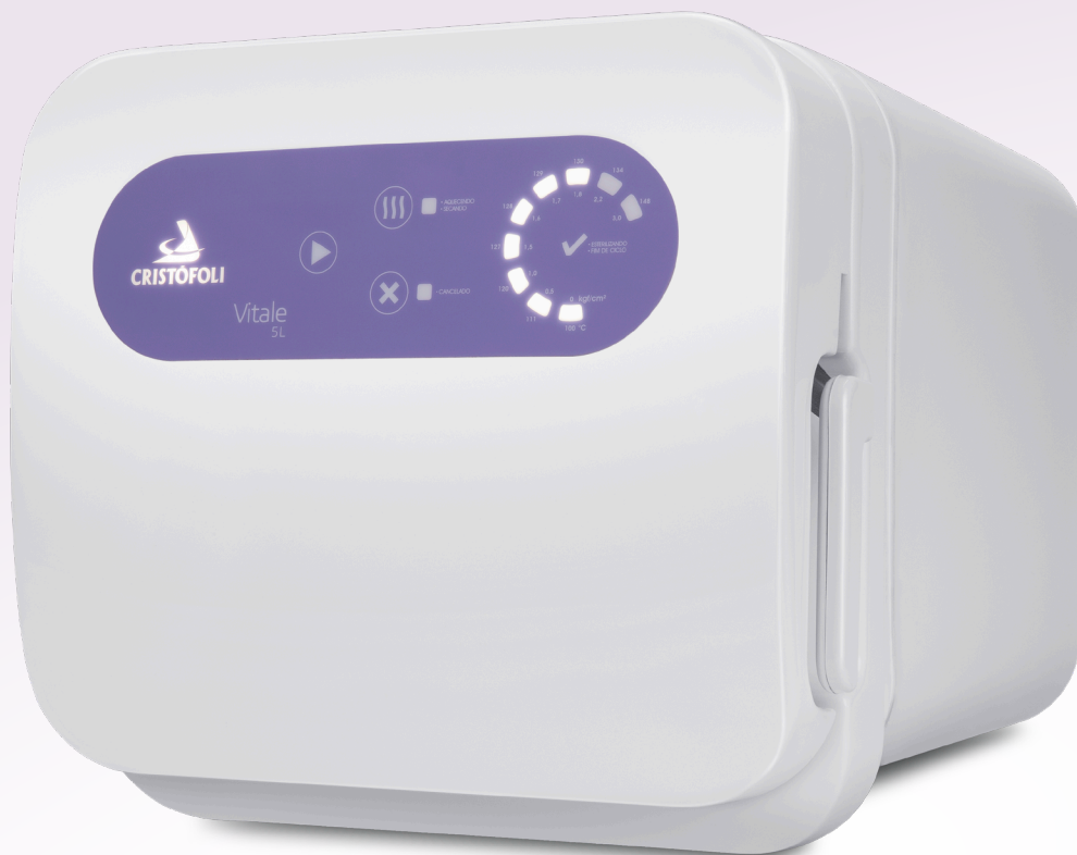
Autoclave Vitale 5L