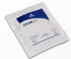
Indicador Químico Integrador SteamPlus