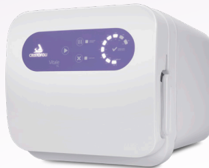
Autoclave Vitale 5 Litros