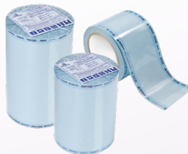
Embalagens Tubulares para Esterilização