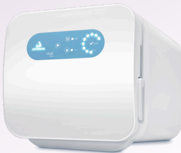
Autoclave Vitale Class 12 e 21 Litros