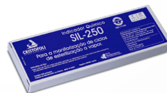
Indicador Químico SIL-250