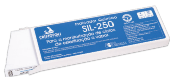
Indicador Químico SIL-250 - Classe 4