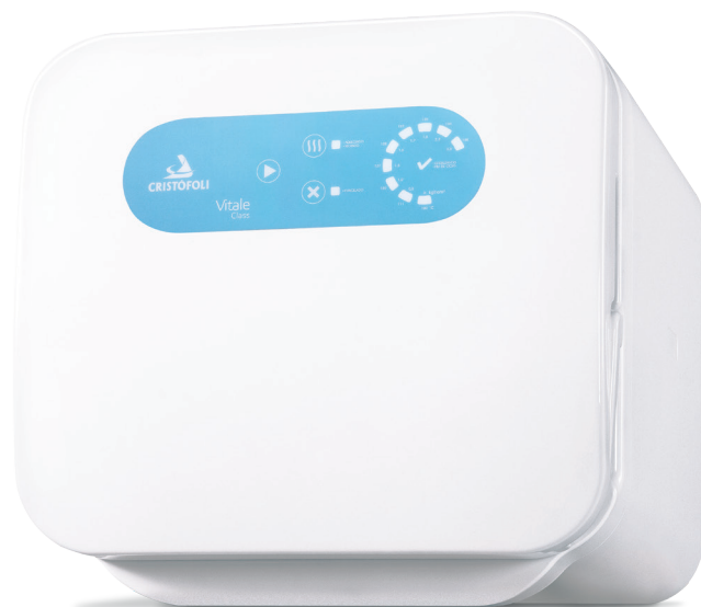
Autoclave Vitale Class 12 e 21L

Como realizar o teste de esterilização em sua autoclave.