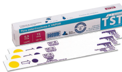
Indicador Químico Emulador TST - Classe 6