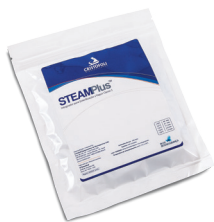
Indicador Químico Integrador SteamPlus - Classe 5